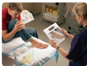
Mit der integrierten Kamera können Sie ganz einfach Fotos oder Filme machen.

Der Motion® C5v ist für die mobile Patientenbetreuung konzipiert und bietet höchste Zuverlässigkeit. Als erster MCA (Mobile Clinical Assistant) der Branche wurde das Modell C5v zusammen mit Intel® Health speziell für die Gesundheitspflege entwickelt. Dabei haben wir uns auf die Eingaben von Tausenden Krankenhausärzten weltweit gestützt. Das leichte, kompakte und vollständig versiegelte Gerät entspricht den Infektionskontrollprotokollen und wird den hohen Anforderungen des Einsatzes im Gesundheitswesen gerecht.