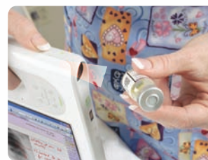
Nutzen Sie das integrierte Barcode-Lesegerät zur Verwaltung von Medikamenten.