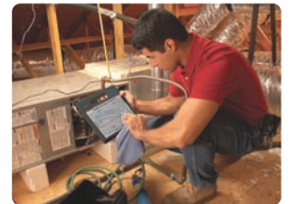
Der robuste F5v lässt sich auch unter schwierigen Bedingungen leicht reinigen.

Robuste Corning® Gorilla®-Glas gehört zur Standardausstattung des Motion F5v, der optimal für den Einsatz im Außendienst geeignet ist. Ein Betrachtungswinkel von 180 Grad , ein beleuchtetes Hydys AFFS+ LED-Display und View Anywhere®-Technologie zur Verringerung unerwünschter Reflexionen sorgen für die optimale Anzeigequalität beim Einsatz des Tablet-PC im Freien. Der F5v ist mit einer Vielzahl von Prozessor-Optionen erhältlich und für Windows® 7 konzipiert. Er kann nicht nur nahezu alle Geschäftsanwendungen ausführen, sondern lässt sich so problemlos integrieren und unterstützen wie jedes andere Gerät im Netzwerk. Der Motion F5v ist so robust und leistungsstark, dass Sie ihn in jeder Umgebung einsetzen können.