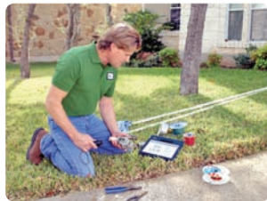
Nehmen Sie Ihren F5v mit, ganz egal wo Ihre Arbeit Sie hinführt.

Besonders erfreulich: Der F5v ist robust. Mit erwiesener Staub-, Hitze- und Witterungsbeständigkeit ist der Motion F5v in jeder Arbeitsumgebung einsatzbereit. Mit dem stabilen Innenrahmen aus einer Magnesiumlegierung sowie dem Erschütterungsschutz für das Display und die Festplatte (HDD) bzw. das optionale Solid-State-Laufwerk (SSD) besteht keine Gefahr eines Datenverlusts durch Schlag- oder Sturzeinwirkung. Der rundum versiegelte F5v ist witterungsbeständig und leicht zu reinigen.